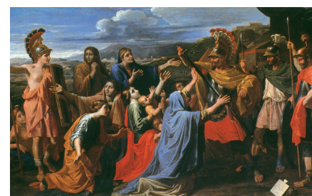
Nicolas Poussin "Le Coriolan supplié par sa mère"

La promenade s'achève par la Fontaine Sainte-Clotilde et le musée Nicolas Poussin vestige des belles demeures d'antan du Grand Andely. Le musée abrite notamment une toile de Nicolas Poussin « Le Coriolan supplié par sa mère ». Considéré comme le plus grand peintre français du XVII ème siècle, Nicolas Poussin est né en 1594, à Villers, hameau des Andelys.